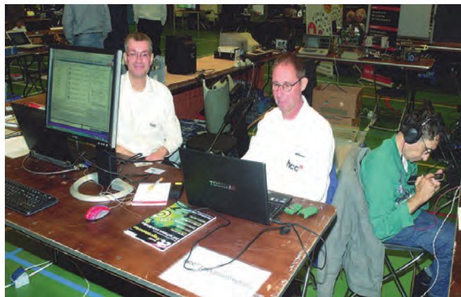
Programmeren met HCC.

Daarnaast was er ook voldoende ruimte voor enige commerciële exploitanten, die bepaald niet alleen maar met oude meuk kwamen, hoewel dat er ook tussen zat en ook nog op veel belangstelling kon rekenen.