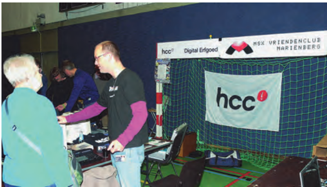
Ook HCC: de MSX Vriendenclub Mariënberg.

Het blijkt toch weer, dat 'de' bezoeker niet bestaat. Er was een veelheid aan personen met allemaal eigen wensen en interesses. Aan de reacties te zien had iedereen het naar zijn zin. Ook de bedrijven waren tevreden, al viel er bij het sluiten toch nog het nodige weer in te pakken.