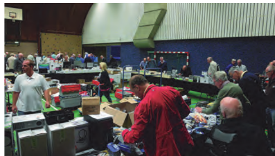
Overzicht van de markt.

Ook hier veel belangstelling en al tijdens de lezing werd er van alles driftig uitgeprobeerd. Verrassend wat je allemaal met een telefoon kunt tegenwoordig. Wist u dat er voor veel toestellen ook voorzetlenzen bestaan, zodat je je telefoon ook met een supergroothoeklenzen of juist met een telelens kunt uitrusten?