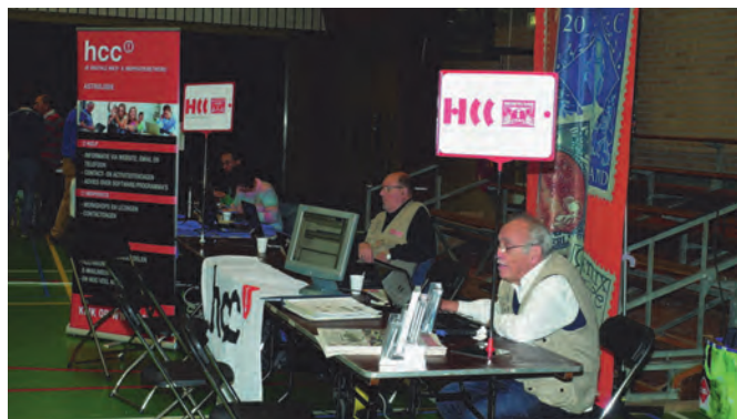
De HCC-interessegroepen Astrologie en Filatelie.

In deze grote zaal natuurlijk ook onze informatiebalie, de redactie van de SoftwareBus en de meeste Platforms. Verder dus vele HCC-interessegroepen, o.a. programmeren, genealogie, astrologie, enz., en niet te vergeten de Testbank.