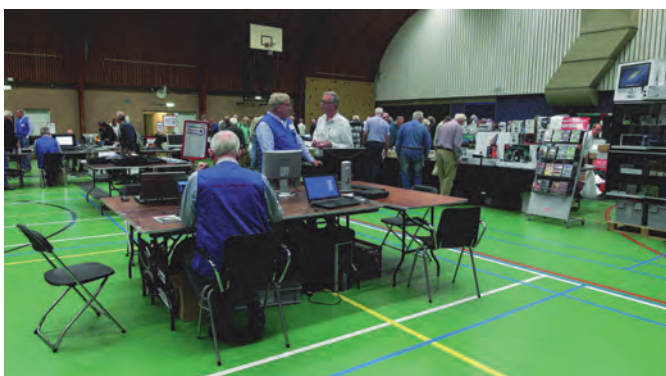
Overzicht van een van de zalen. Op de voorgrond de redactietafel. Meer achterin staan de handelaren met 'voor elk wat wils'.

Het deed mij dan ook deugd te kunnen vaststellen dat u in groten getale aan de oproep gehoor heeft gegeven. Ik weet niet of het een record was, maar het aantal bezoekers overtrof zeker onze stoutste verwachtingen. Tussen de zes- en zevenhonderd bezoekers hebben we geregistreerd en dan reken ik ons eigen kader nog niet eens mee.