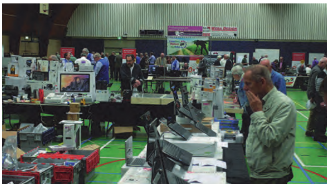
Voldoende ruimte voor commerciële exploitanten, die ook nog op veel belangstelling konden rekenen.

Natuurlijk, alles zat ook mee. Hoewel, het was natuurlijk ook een heel mooie dag voor een wandeling in het bos, of een dagje winkelen. Maar toch, blijkbaar zal alles mee. We hadden een heel groot deel van ons vertrouwde H.F Witte Centrum ( http://www.hfwitte.nl ) afgehuurd en voor een spetterend programma gezorgd. Ik ga dat niet in zijn geheel herhalen, want ongetwijfeld heeft u ook SoftwareBus nummer 2015-4 nog in uw bezit.