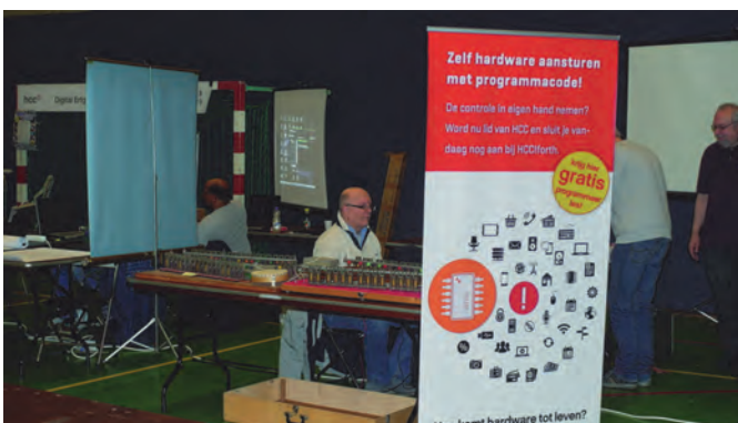
HCC-interessegroep Forth is een groep die geïnteresseerd is het werken met de programmeertaal Forth.

In de Oostbroekzaal was weer volop muziek. Niet alleen vanuit ons Platform, maar onder meer ook de Hcc!Forth i.g. gaf hier acte de présence door middel van een orgeldemonstratie. De combinatie muziek en computer is toch een fantastisch creatief fenomeen!