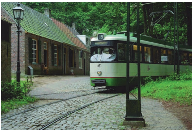
De museumtram. Een geliefd vervoersmiddel én foto-object

Na aankomst bij het museum en tijdens de voorpret onder genot van koffie en oud-Hollands appelgebak werden wat groepjes gevormd, voor degenen die de voorkeur gaven aan een bepaald type fotografie. Al snel waaierden de deelnemers uit over het grote museumterrein, maar de nog vrij nieuw opgezette Jordaanse buurt bleek een geliefd start- en fotopunt te zijn. En daarna mocht graag de historische tram worden genomen naar een andere fotolocatie. Waarbij de trams en de conducteurs zelf ook geliefde foto-objecten bleken.