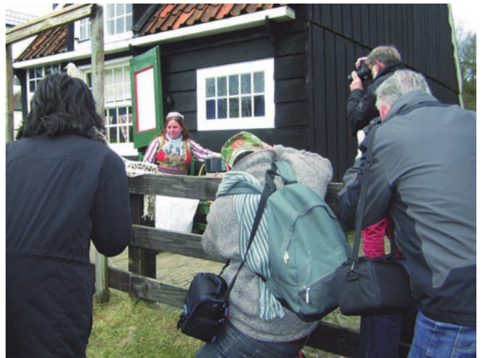
De deelnemers zijn zelf het onderwerp geworden

Ook grappige momenten werden vastgelegd; zie de geslaagde shots van Isja Nederbragt en van Tjaha Dharmaperwira, waarbij een aantal deelnemers zelf op ludieke wijze zijn ver-eeuwigd. En ten slotte - heel goed - lieten sommigen ook grensverleggende fotografie zien.